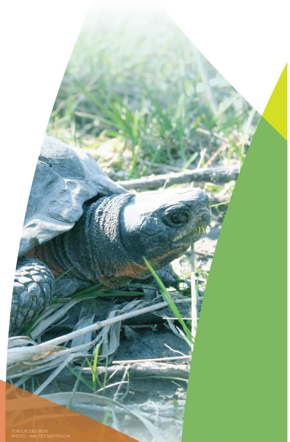
TORTUE DES BOIS

Fondements d'une stratégie d'adaptation aux changements climatiques